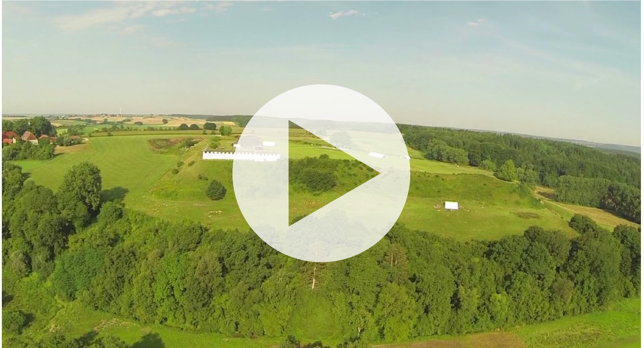
VIDEODOKUMENTATION — DIE HEUNEBURG