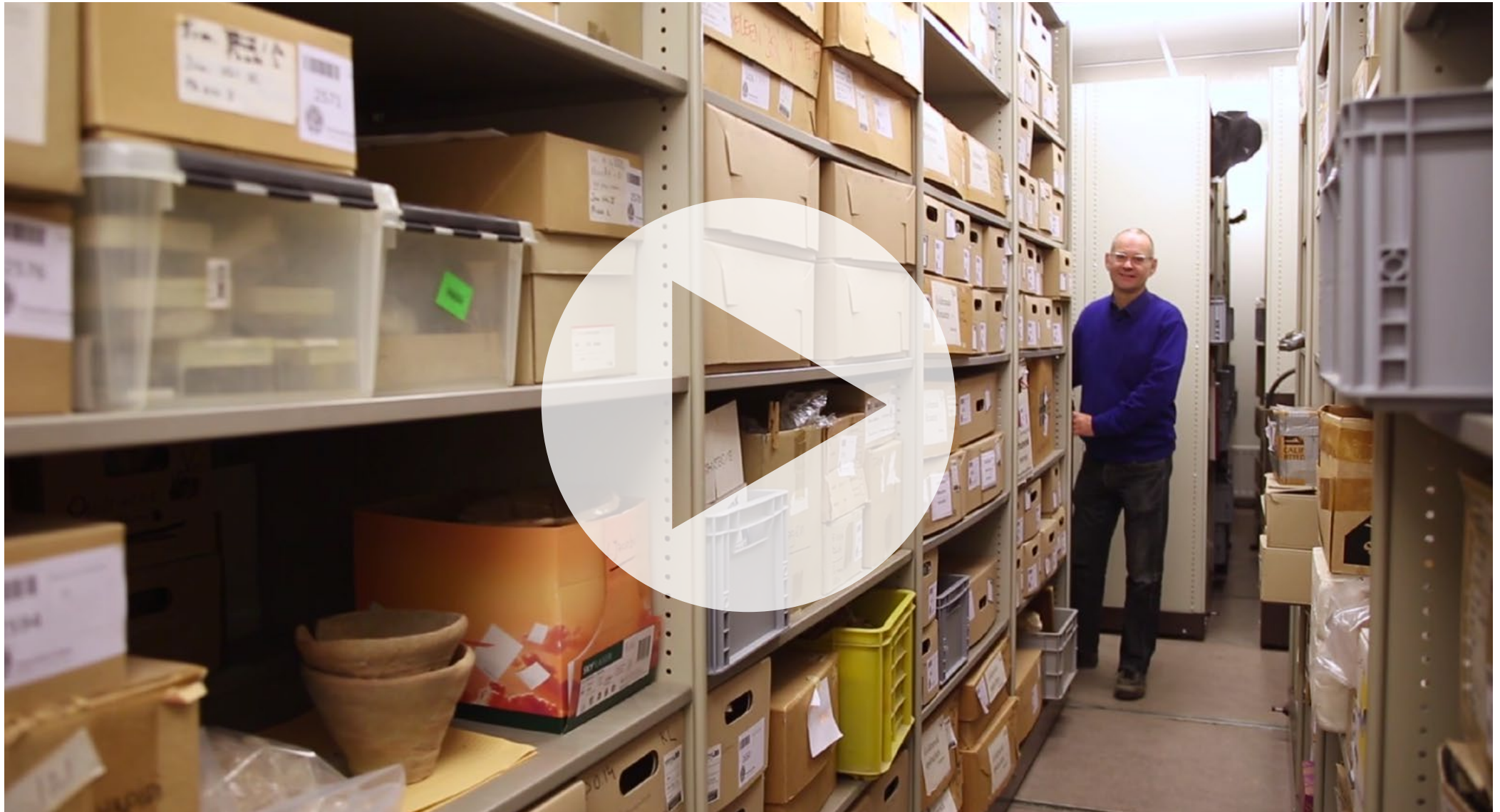
VIDEODOKUMENTATION — LEIDEN