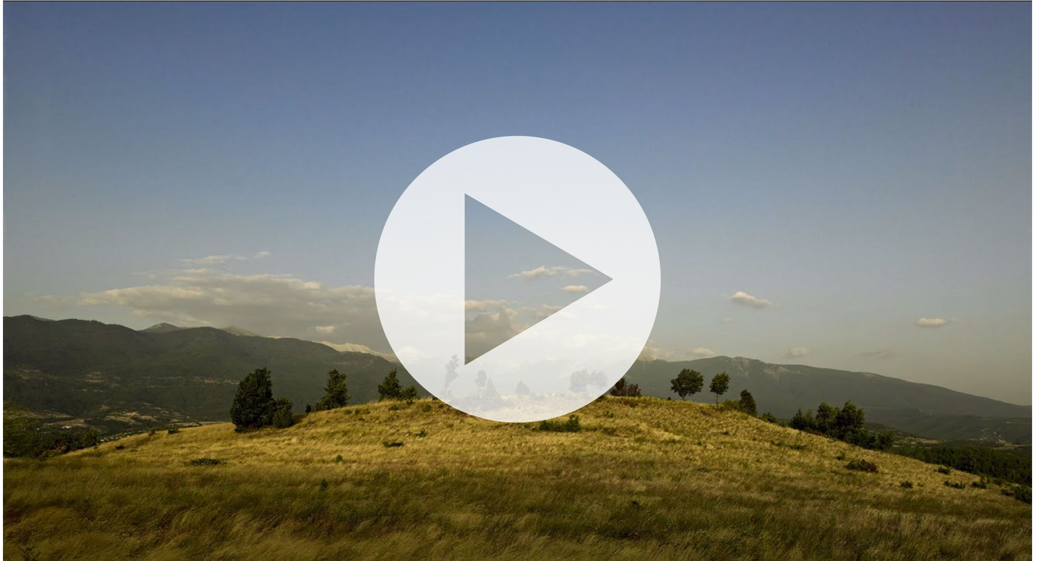
VIDEODOKUMENTATION — ETHNOGRAPHY OF AN ARCHAEOLOGICAL EXCAVATION